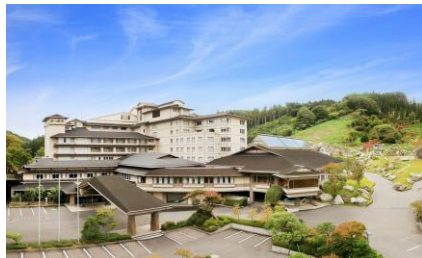
母畑温泉・八幡屋