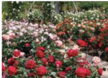
あしかがフラワーパーク